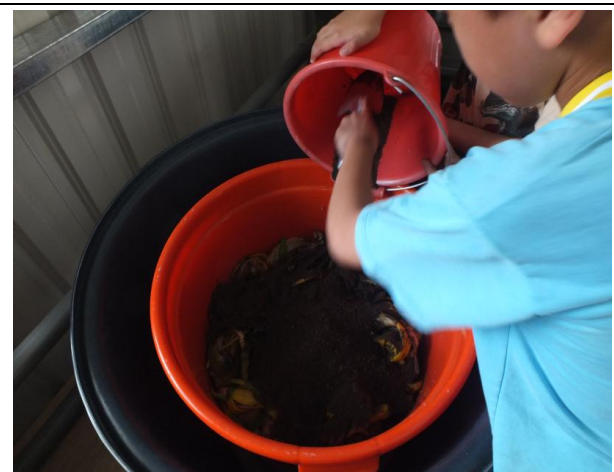
建置落葉與廚餘堆肥區