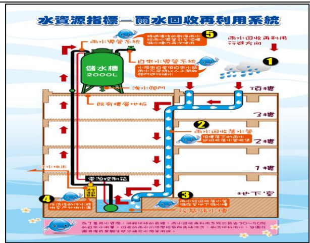
雨水回收系統與平面解說牌