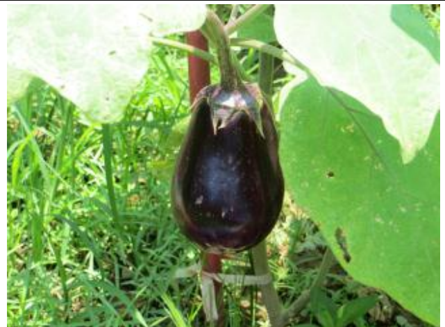
利用有機堆肥種植蔬菜