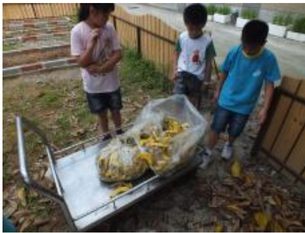
廚餘果皮製成有機堆肥