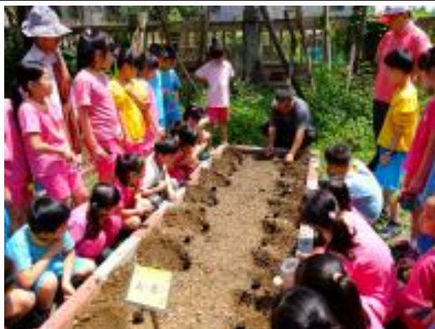
利用有機堆肥種植蔬菜