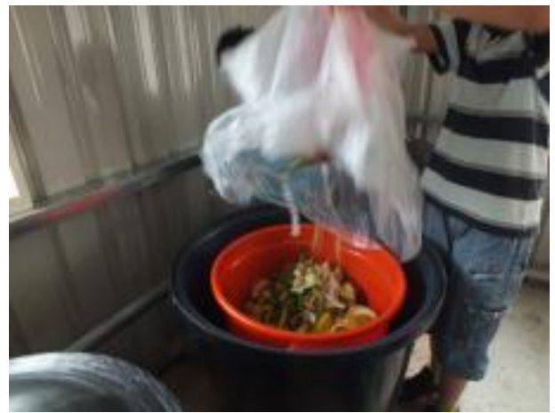
廚餘果皮製成有機堆肥