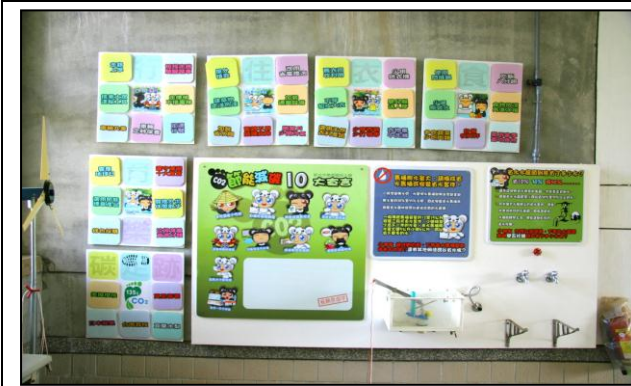
能源教育--節能補給站學習角