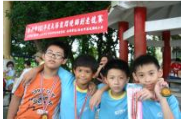
能源教育—學生參加新北市太陽能 悶燒鍋製作競賽獲得最佳創意獎