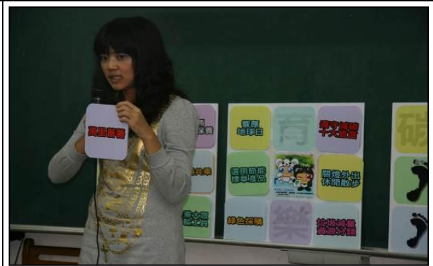
自製能源教學媒體、教材進行教學